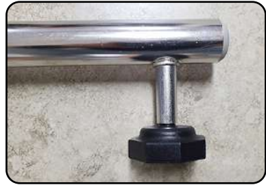
② 받침대 노브에 설치하여 높이 조절