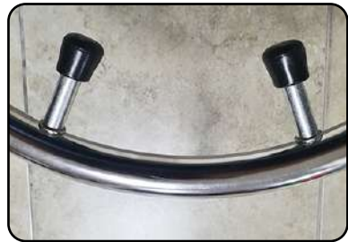
③ U-프레임 범퍼 노브에 설치하여 길이 연장