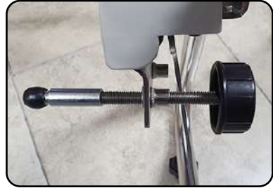
① 고정노브에 설치하여 길이 연장