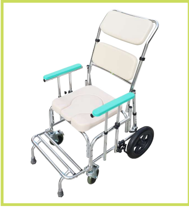
머리 받침대 타입