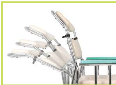
등판 각도 조절 가능