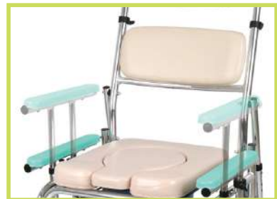
팔걸이 높낮이 조절 가능