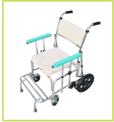
후방 손잡이 타입