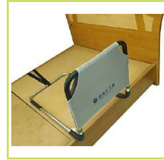
1. 침대프레임에 설치된 모습